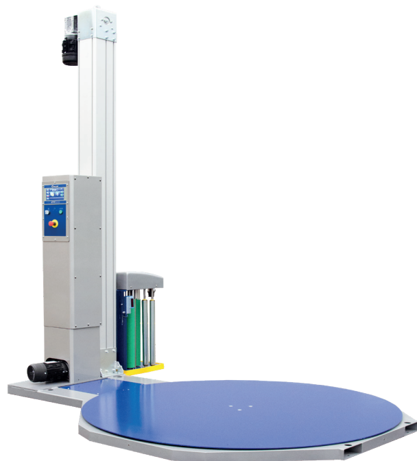
Dimensiones CTT 300

– Clickea aquí para un video de la CTT 300 –